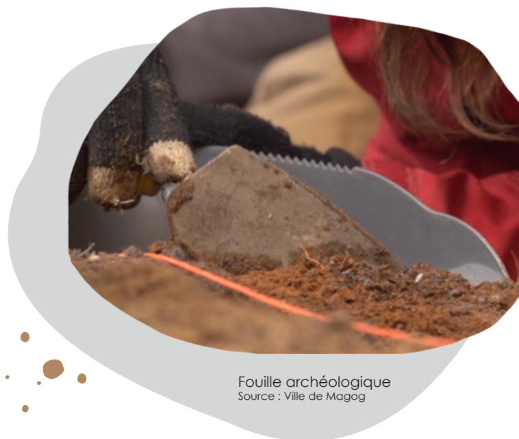
Fouille archéologique

Le non-respect de cette disposition constitue une infraction et est passible d'une amende.