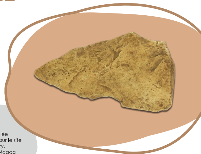
Outil de pierre taillée (biface) retrouvé sur le site de la Maison Merry.

Ces sites comportent des artefacts qui renseignent sur la présence d'autochtones et sur la période de développement de la ville.